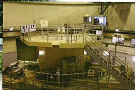
昭和35年に開設した原子力研究所（川崎市麻生区）と研究炉「武蔵工大炉（現在は廃止措置中）」。原子力技術者育成のための拠点となっています。